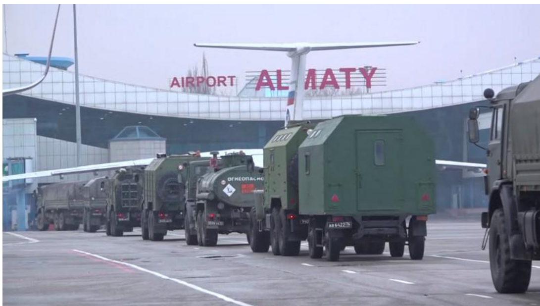
Войска ОДКБ в аэропорту Алматы

Власти Казахстана пытаются не затрагивать тему участия иностранного военного контингента ОДКБ во время массовых расстрелов и пыток мирных граждан в январе 2022 года. Законность и обоснованность введения иностранного военного контингента в страну не стало предметом расследования следственных и политических органов. При этом некоторые детали введения военного контингента ОДКБ свидетельствуют, что фактически это была военная интервенция России с целью не допустить падения существующего в стране лояльного ей авторитарного режима. Так, начало масштабных акций протеста, которые охватили всю страну, сопровождалось случаями перехода полицейских и военных на сторону протестующих. Власти Казахстана оказались перед риском потери контроля над силовыми ведомствами в стране. Поэтому было принято решение усилить защиту казахстанского режима военным контингентом ОДКБ. Вмешательство ОДКБ во главе с Россией еще более усилило зависимость Казахстана и персонально Касым-Жомарта Токаева от диктаторского режима Путина.