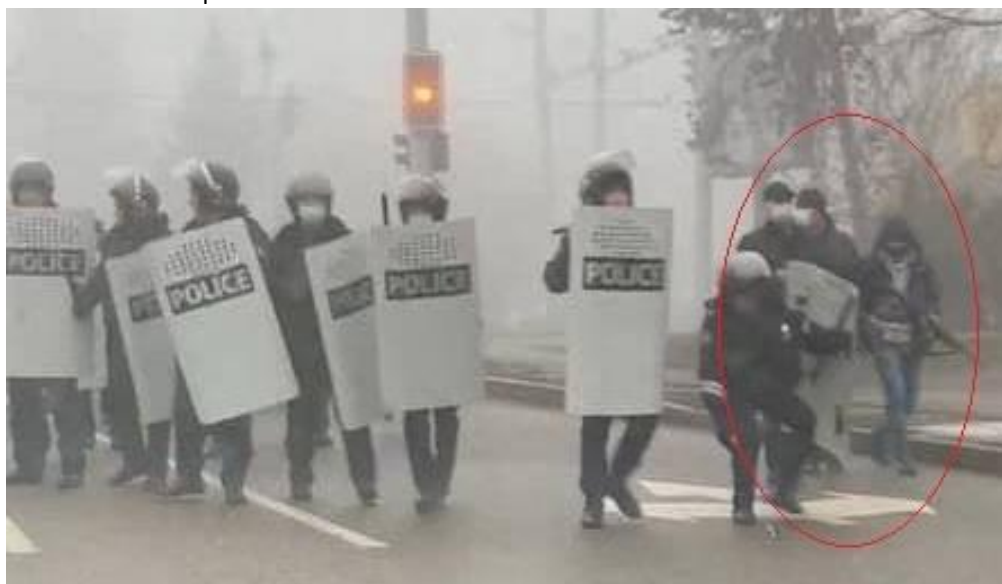
Вооруженные лица в гражданской одежде среди сотрудников полиции в Алматы