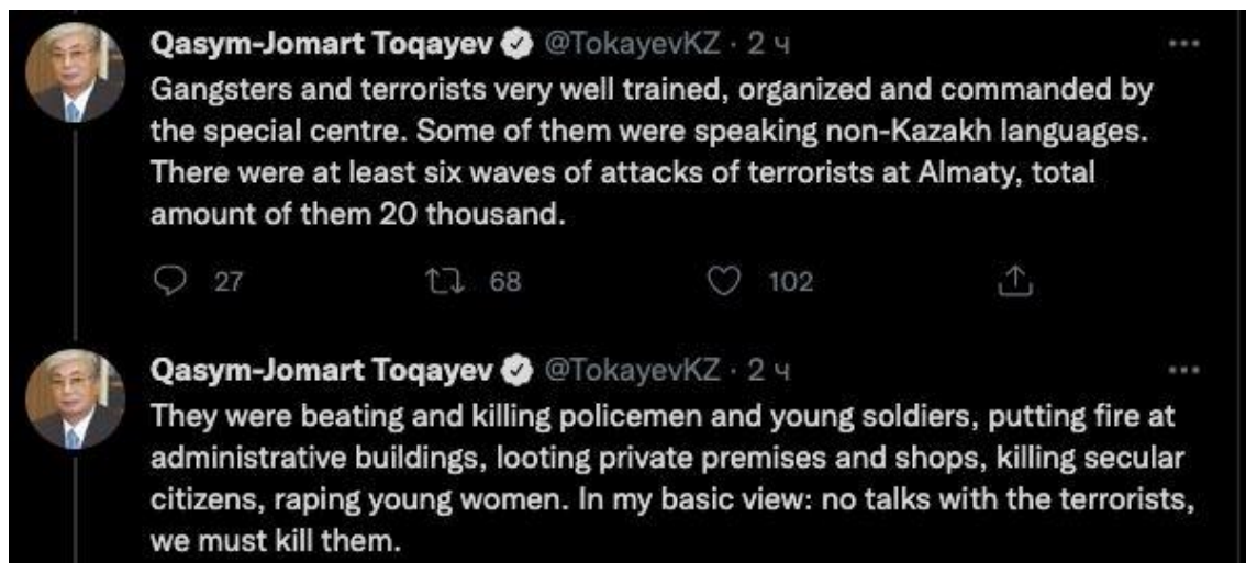
Сообщение в Twitter Касым-Жомарта Токаева о «20 000 террористов»

огнестрельное оружие было применено около 16 часов 05.01.2022 при обороне резиденции президента в Алматы, поэтому якобы невозможно рассматривать приказ Токаева как причину массовых расстрелов. 16.03.2022 в своем обращении к народу Касым-Жомарт Токаев заявил, что множественные жертвы во время подавления протестов – это результат «преступных действий радикалов и террористов» 105 .