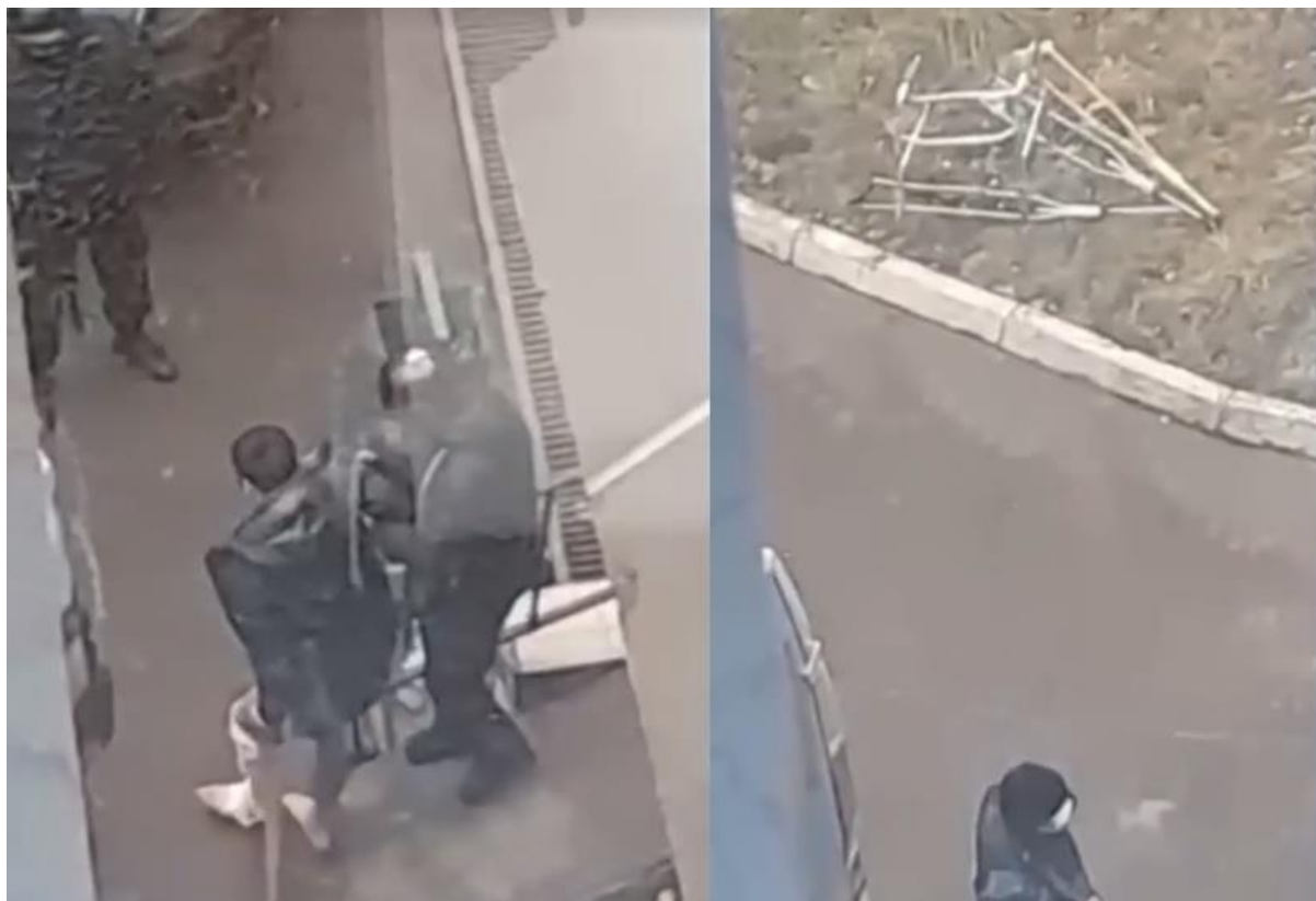
Полиция выводит травмированных из больницы, отбирая и выбрасывая их костыли