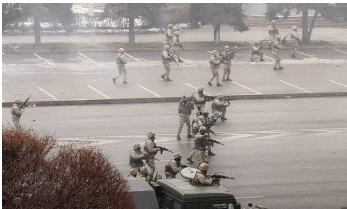
Военные в Алматы во время разгона мирных акций протеста в январе 2022 года

Президент Касым-Жомарт Токаев предложил внести изменения в Конституцию после сильной негативной реакции общества на действия властей во время и после трагических январских событий. Таким образом он намеревался успокоить и отвлечь общество от массовых расстрелов протестующих, ввода войск ОДКБ и последующих массовых пыток, информация о которых стала публичной, и продемонстрировать, что в стране грядут качественные изменения в структуре власти. Для снижения напряжения в обществе по отношению к власти и нейтрализации негативного отношения к Нурсултану Назарбаеву, его семье и к самому Токаеву, конституционная реформа должна была ослабить роль президента, уменьшить влияние на власть Назарбаева и его семьи, и усилить другие ветви власти. Поправки в Конституцию предусматривают, в частности, ограничение президентского правления одним сроком длительностью 7 лет, восстановление в Казахстане Конституционного суда, исключение из Конституции всех упоминаний о первом президенте Нурсултане Назарбаеве, запрет президенту быть членом политических партий, запрет родственникам президента занимать руководящие должности в государственном секторе, введение смешанной избирательной системы на выборах в Мажилис (нижняя палата Парламента Казахстана), разрешение беспартийным гражданам баллотироваться в парламент, а также якобы упрощение процедуры регистраций новых партий.