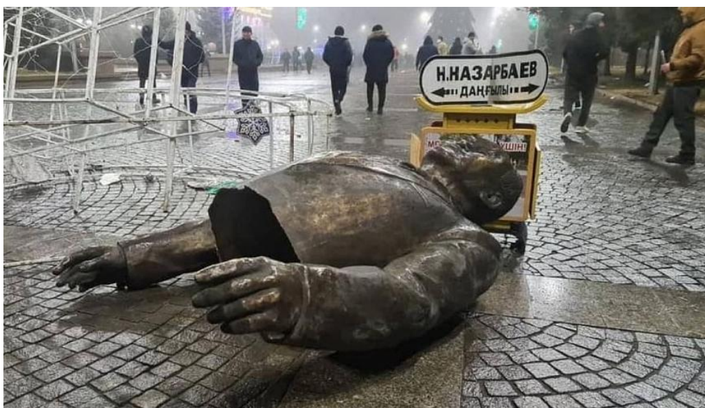
Снесенный памятник Нурсултану Назарбаеву в Талдыкоргане.