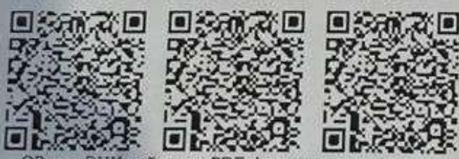
QR-код ЭЦҚ қойылған PDF форматтағы электрондық құжаттың хэш соммасын қамтиды