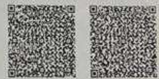
QR-код қол қойған тұлғаның ЭЦҚ туралы деректерін, лауазымын, мемлекеттік органның атауын, құжатқа қол қойған күнді мен уақытты қамтиды